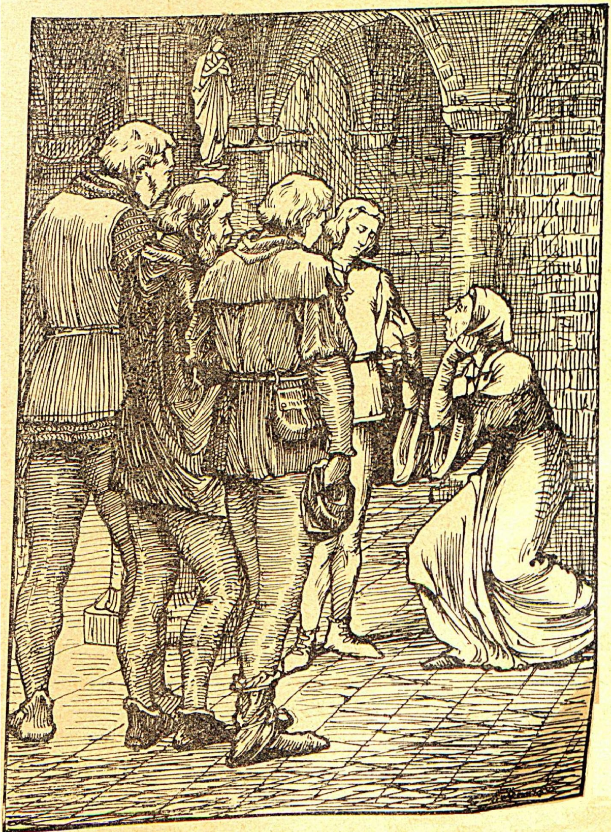
Paul fit de la tête un geste affirmatif. ( Page 708 )

Pentekening bladzijde 697 / illustration page 697