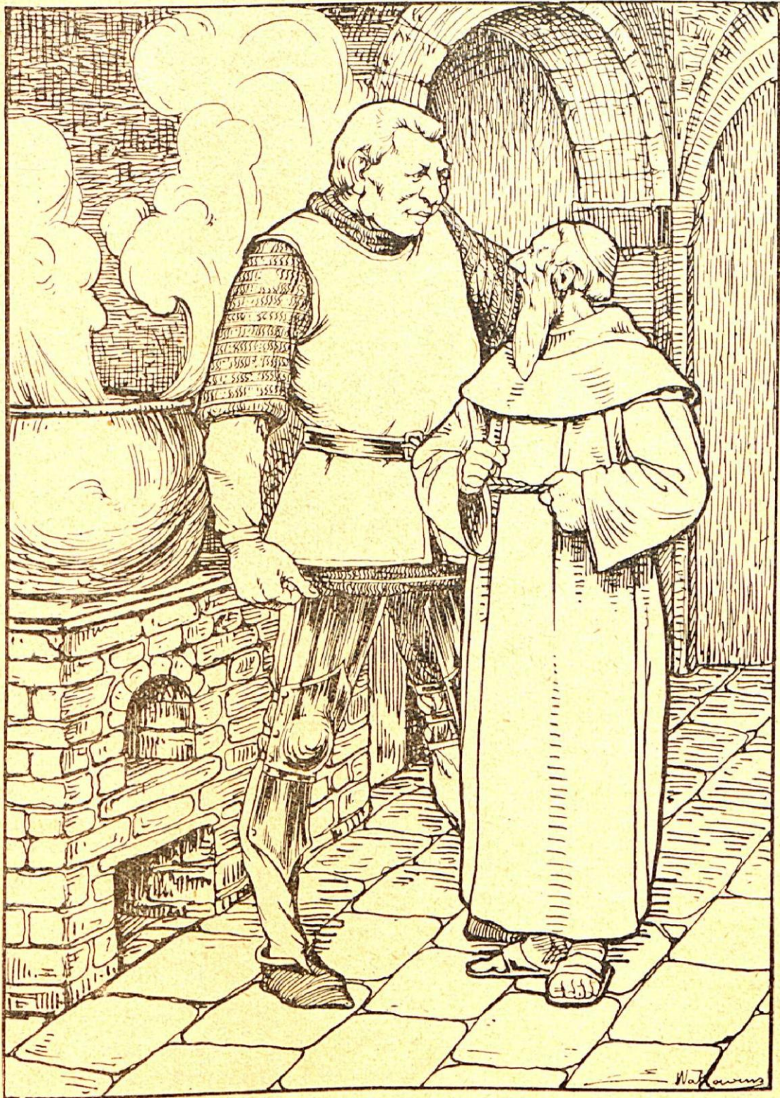
— Gardez votre pitié pour vous. (page 266)